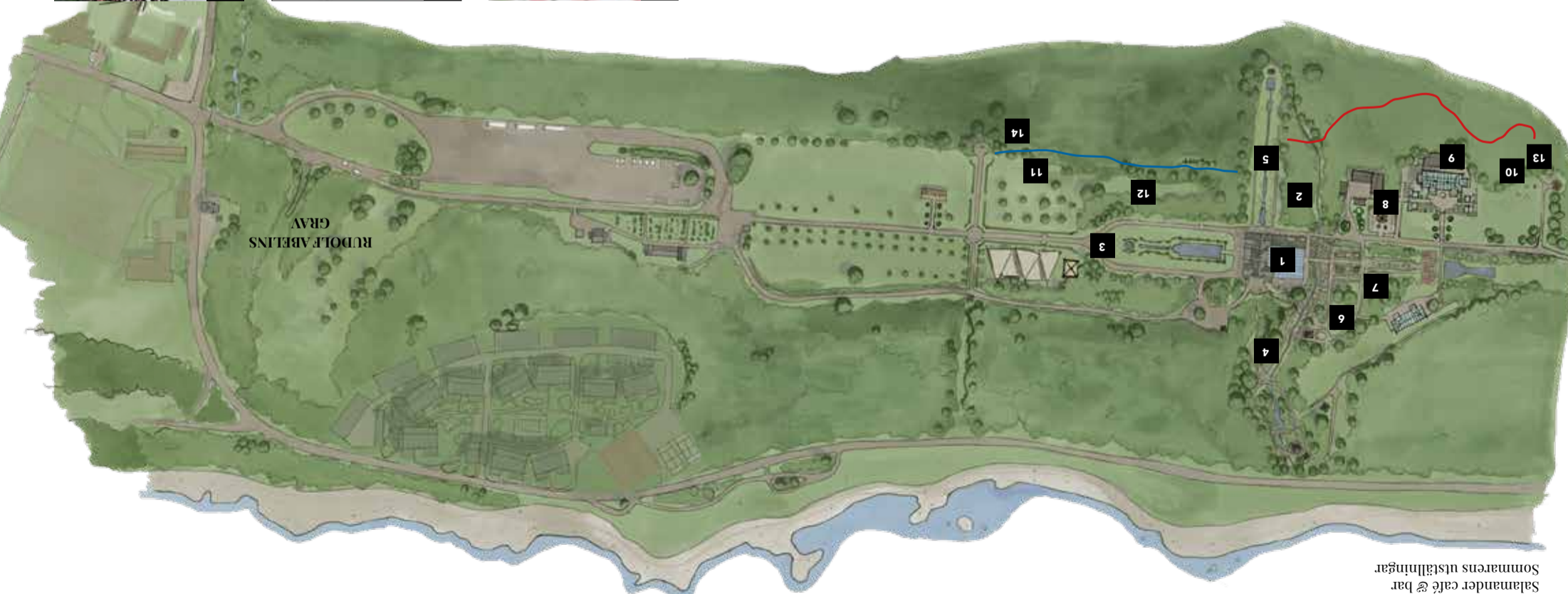
RENÄSSANSSTRÄDGÅRDEN/ NORDTYSKA PLANTERINGEN